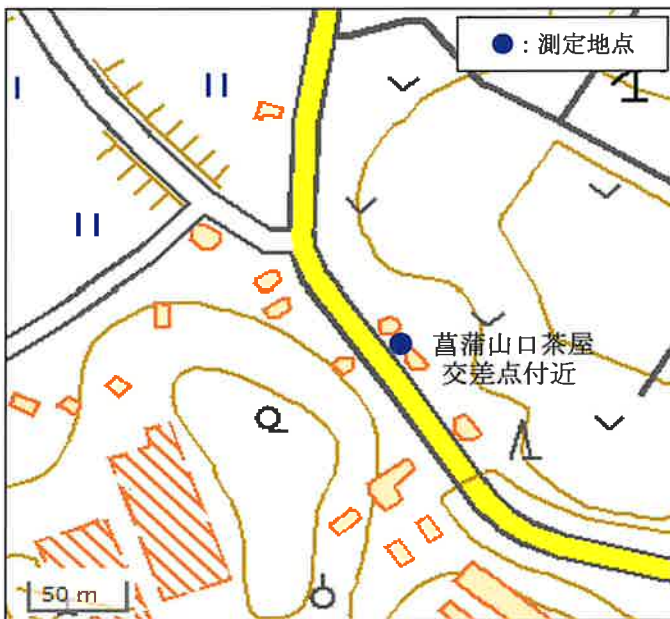
国土地理院の地理院地図