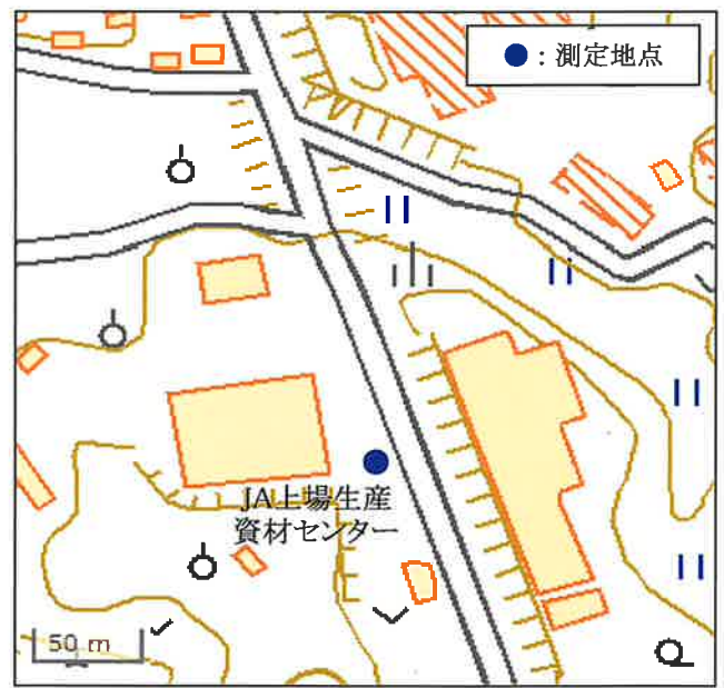
国土地理院の地理院地図