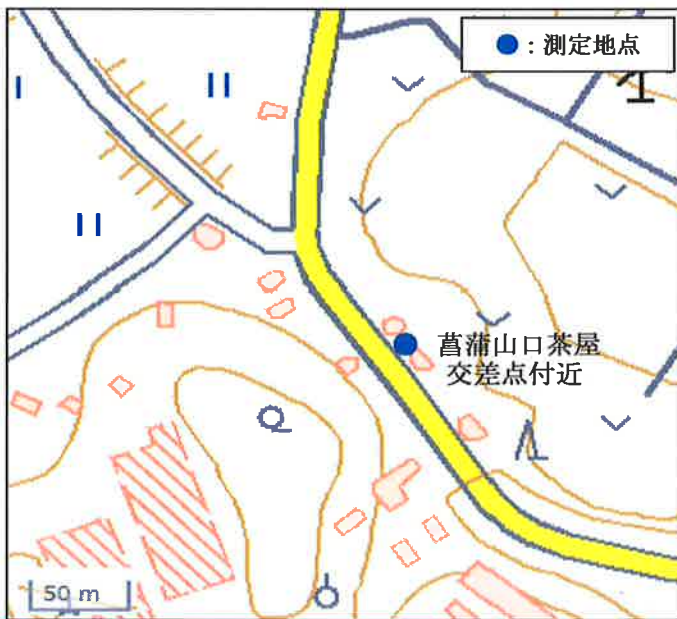
国土地理院の地理院地図