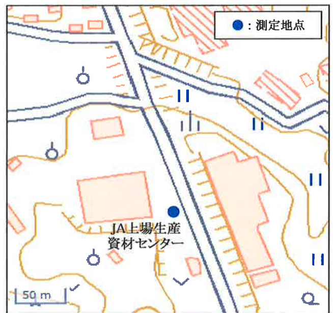
国土地理院の地理院地図